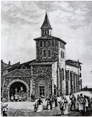
De kapel van Fourvière in de dagen van de eerste Maristen.

Op 23 juli 1816 beklommen twaalf jonge mannen de heuvel van Fourvière met dat bijzondere uitzicht op de stad Lyon, Frankrijk. Ze gingen naar de oude kapel van de Heilige Maagd. Al eeuwenlang kwamen katholieken naar dit heiligdom om er Maria's voorspraak te vragen over al hun verlangens en toekomstdromen.