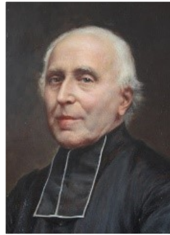
De eerbiedwaardige Pater Jean-Claude Colin, Stichter van de Sociëteit van Maria

... 'Options for Pilgrims. 2: Bugey Missions.'