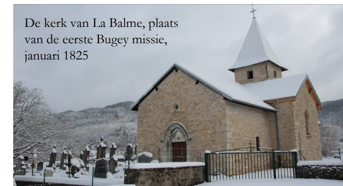
De kerk van La Balme, plaats van de eerste Bugey missie, januari 1825

Het bergachtige gebied van de Bugey maakt deel uit van een groot massief dat Frankrijk scheidt van Zwitserland. De vele parochianen op het platteland waren slecht behandeld tijdens de Franse Revolutie. Priesters waren door de revolutionairen vermoord of verbannen, terwijl anderen ontmoedigd en lusteloos achterbleven. Naar deze afgelegen gemeenschappen werden de eerste Maristen gestuurd om de mensen weer tot geloof te brengen, hen weer hoop te geven en de genade van Gods barmhartigheid te verkondigen aan deze verwaarloosde mensen. De geestelijke behoeften waren enorm, met veel ongeldige huwelijken en grote achterstand in het toedienen van de sacramenten.