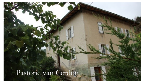
Pastorie van Cerdon