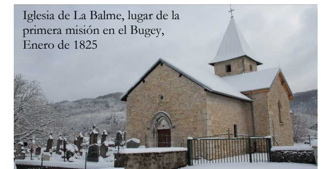
Iglesia de La Balme, lugar de la primera misión en el Bugey, Enero de 1825

Con la gran necesidad de Monseñor Devie , los maristas compartieron el proyecto de reavivar la fe entre la gente con su particular espíritu.