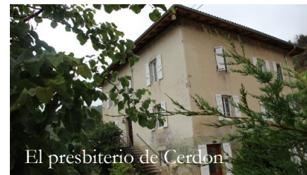
El presbiterio de Cerdón