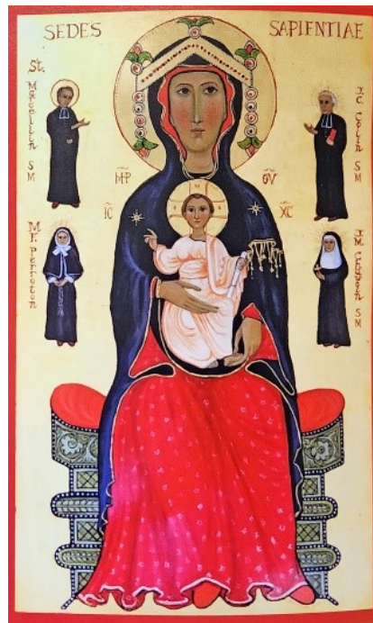
"Sedes Sapientiae" (Sede de la Sabiduría), de Ursula Betka, que representa a los cuatro fundadores maristas. (Aquinas College, North Adelaide, Australia.)

Su presencia completa la Familia Marista, un árbol con muchas ramas.