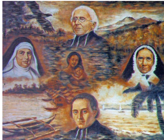
Quattro Fondatori Maristi con Maria e il Bambino Gesù

Chiesa, il papa e vescovi, affinché possiamo essere efficaci ministri di Gesù Cristo.