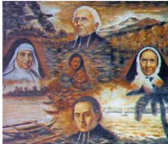
Quattro Fondatori Maristi con Maria e il Bambino Gesù

Chiesa, il papa e vescovi, affinché possiamo essere efficaci ministri di Gesù Cristo.