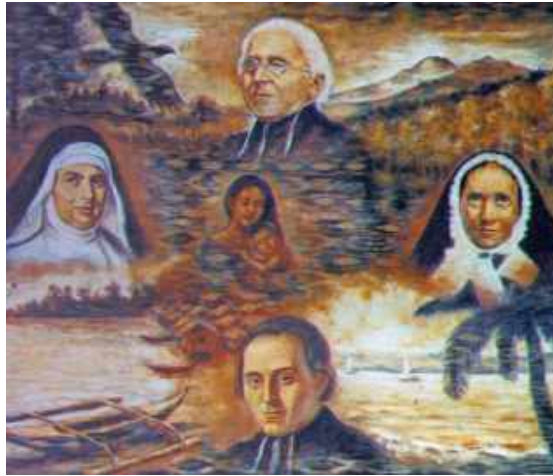
Quatre Fondateurs Maristes avec Marie et l'Enfant Jésus

Nous promettons fidélité, au sein de notre sainte Mère Eglise catholique romaine, au pontife romain, ainsi qu'au révérendissime